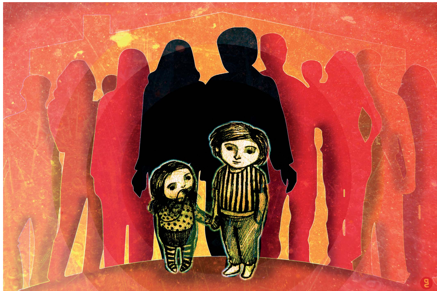
illustratie Geertje Grom

Er zijn drie mogelijke maatregelen: ondertoezichtstelling, ontheffing van het ouderlijk gezag of ontzetting uit het ouderlijk gezag. De lichtste en meest voorkomende is ondertoezichtstelling. Het gezag van de ouders kan dan worden ingeperkt. Er wordt een gezinsvoogd toegewezen die de ouders en het kind begeleidt bij het oplossen van de problemen. Het gezin moet die hulp accepteren. De ondertoezichtstelling